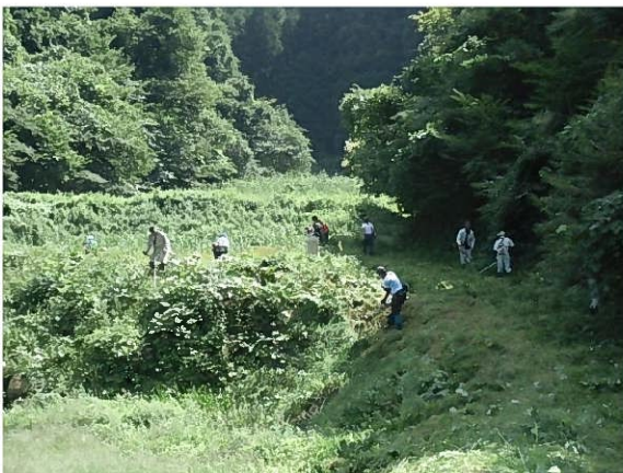
遊休農地の草刈り