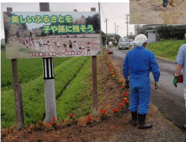
景観形成の ための 花の植栽