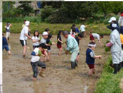
田んぼでの 体験学習