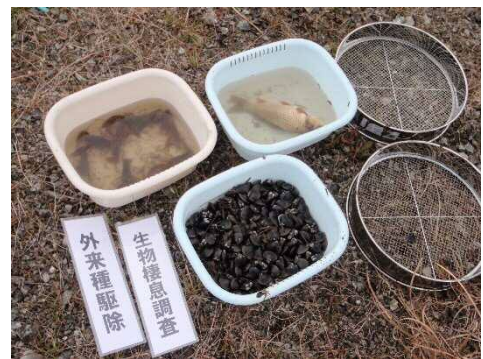
生物棲息調査 外来種駆除