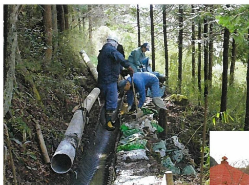
水路の補修などを共同活動で実施