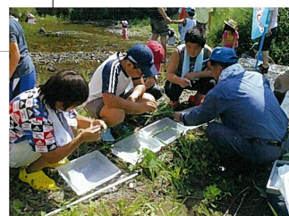
水質調査は子供たちも積極的に参加