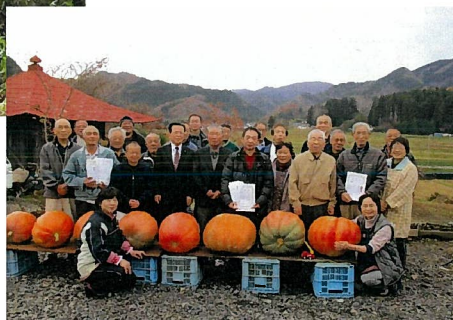
大収穫祭、ジャンボかぼちゃコンテストを行い地域内交流