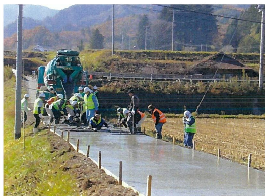
直営施工による農道のコンクリート舗装

直営施工による農道の舗装や遊休農地活用によるそば栽培など幅広い活動を行うほか、大収穫祭等のイベントや話し合いの場を多く設けて、より良い「農村地域づくり」を目指して地域の活性化と交流を図っています。